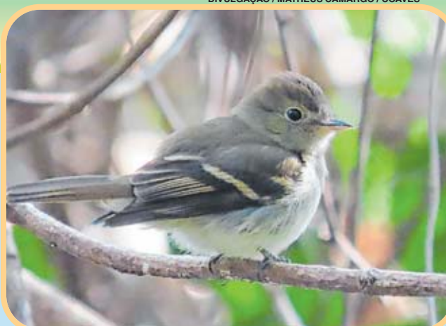
O enferrujado tem penas marrom-esverdeadas, asas com duas listras claras e bico com duas cores

Gosta de viver em matas e florestas mais fechadas, sempre per-